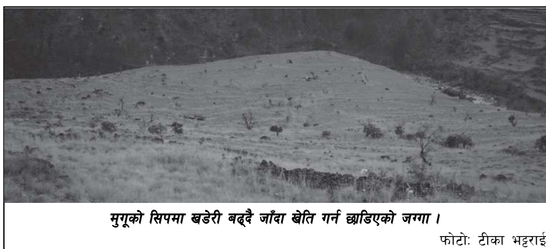
मुगूको सिपमा खडेरी बढ्दै जाँदा खेति गर्न छाडिएको जग्गा ।

पहिलो कुरा त सुदुर गाउँका मानिसहरूले कसरी पेटभरि खान पाउँछन् भन्ने नै हो। त्यसका लागि स्थानीय खाना र उत्पादनमा जोड दिनु नै प्रमुख विकल्प हो। बाहिरबाट मात्रै चामल र अन्य खाद्यान्न हुवानी गर्नु भन्दा त्यहीँको स्थानीय उत्पादनलाई जोड दिनु खाद्य सुरक्षाको उत्कृष्ट उपाय हो। त्यहाँको स्थानीय उत्पादनलाई कसरी बढाउन सकिन्छ भन्ने कुरामा धेरै नै जोड दिनुपर्ने भएको छ। त्यसका लागि कम खर्चिलो कृषि पद्धति जनस्तरमा पुऱ्याउनु जरुरी छ। बाहिरबाट भइरहेको खाद्य आपूर्तिको निरन्तरताले ग्रामीण क्षेत्रको खाद्य समस्याको समाधान भइरहेको देखिँदैन। तसर्थ स्थानीय खाद्यान्नको प्रवर्द्धन तथा दीगो खेतीपातीको अभ्यासमा जोड दिनुपर्ने हुन्छ।