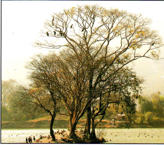
काठमाडौंको टौदह (पवित्र सिमसार) मा आप्रवासी चराहरूको बासस्थान

आइसीसीएहरु पहिचान सहित क्रियाशील हुन र फस्टाउन सक्छन्, यद्यपी विस्तृत कानुनी उपकरण आवश्यक नहुन सक्छ। यो लक्ष्यतर्फको प्रमुख नीतिगत परिवर्तनमा ठूलो प्रयास, स्रोत र फरक चिन्तनको खाँचो पर्दछ तथापि सानोतिनो व्यावहारिक पहलले समेत केही हदसम्मको प्रक्रिया शुरु गराउन सक्छ।