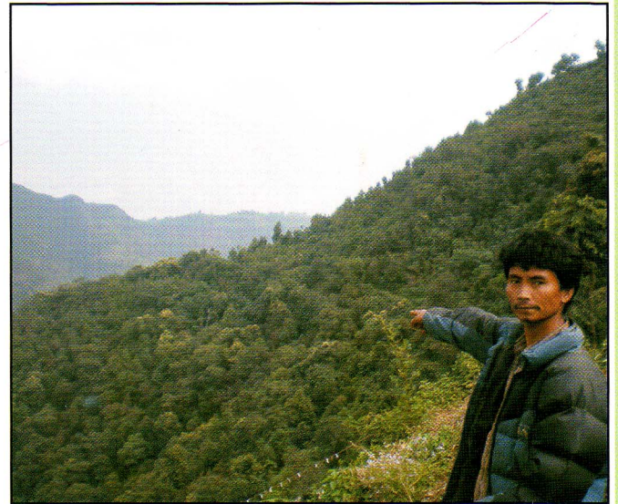
चितवनको हपनी, काउलेमा अवस्थित स्थानिय चेपाङ्गद्वारा संरक्षित वन।

संसारमा यस्ता आइसीसीएहरू विभिन्न स्वरूपमा दशौं हजारको संख्यामा भएपनि अधिकांशलाई सरकारी मान्यता दिइएको छैन। जैविक विविधताको संरक्षण गर्न, आवश्यक पारिस्थितिक प्रकार्य (ecological function) एवम् वातावरणीय सेवा कायम राख्न अर्थात् पर्यावरण जोगाउन, जीविकोपार्जन र सांस्कृतिक